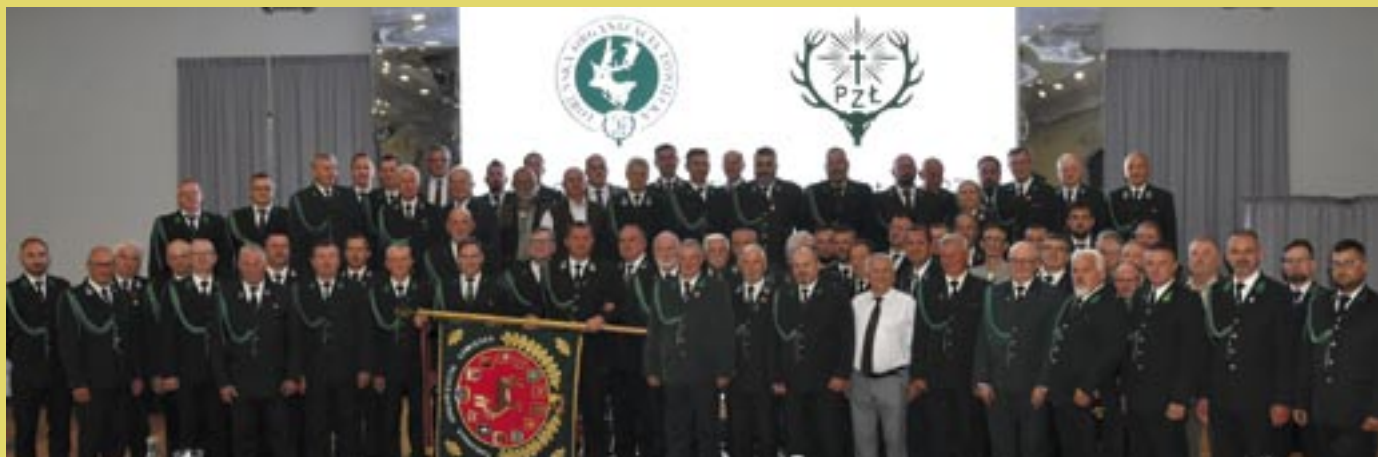
Uczestnicy okręgowego Zjazdu Delegatów w Wąbrzeźnie.

nia: Okręgowego Sądu Łowieckiego, Okręgowego Rzecznika Dyscyplinarnego i Zespołu Nadzorczo-Kontrolnego. Po dyskusji nad sprawozdaniami, większością głosów podjęto uchwały zatwierdzające ww. sprawozdania.