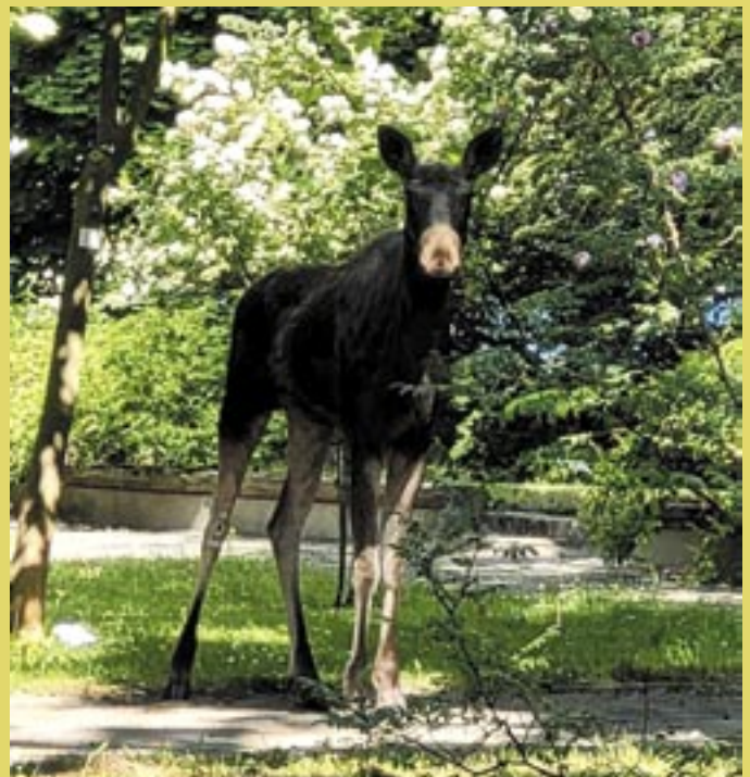
Łoszak w Ogrodzie Botanicznym UKW - centrum Bydgoszczy.

Autor artykułu w latach osiemdziesiątych był stypendystą Królestwa Szwecji, już wówczas obserwował liczne stłuczki aut z łosiami. Największe nasilenie występowało jesienią po bukowisku lub w miesiącach maj/czerwiec, gdy łoszaki zostają pozbawione opieki matki. W Szwecji doradzono kierowcom, że gdy przy kolizji nie ma szansy omińnięcia zwierzęcia, to w odruchu powinniśmy skierować auto na tylne badyle, aby je złamać. Ten odruch