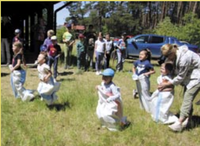
Zabawy z dziećmi...

Wspomnieć należy, że dziś w konkursach byli tylko wygrani – każde dziecko otrzymało nagrody i pamiątki. Dorośli również nie mieli czasu na nudę, bowiem i dla nich postaraliśmy się zorganizować niespodzianki. To, że wszystko udało się wyśmienicie, potwierdził fakt, że czas upłynął w oka mgnieniu, a każdy wsiadając do auta zapowiedział, że za rok chętnie tu wróci.