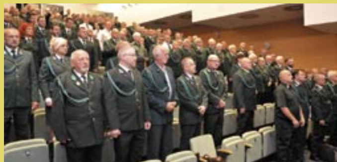
Delegaci okręgu bydgoskiego PZŁ.