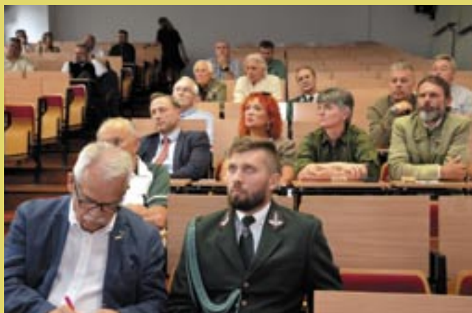
Uczestnicy spotkania w Bydgoszczy.

Zauważył, że wzrosły koszty dzierżaw obwodów w wyniku zmiany ich kategorii.