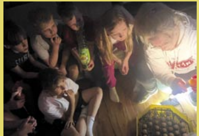
Obserwowali proces klucia.

Dosłownie troje uczniów otwarcie wyraziło swój sprzeciw do myślistwa. Sprowokowało to konstruktywną dyskusję. Młodzi ludzie mieli swoje argumenty, nie było to przysłowiowe „nie bo nie”, co cieszy najbardziej. Nie było też nacisku na wzajemne przekonywanie się. Pozostało pole do przemyśleń i konfrontacji z rzeczywistością.