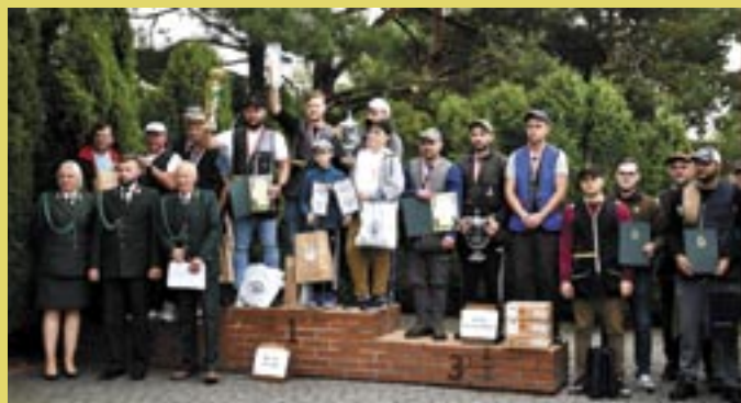
Podium w klasyfikacji drużynowej.

Zwycięska drużyna, czyli reprezentacja ZO PZŁ w Poznaniu otrzymała Puchar Zarządu Głównego. Puchar przechodni im. Adama Monikowskiego za najlepszy wynik zespołowy w strzelaniu śrutem również otrzymała drużyna reprezentująca ZO PZŁ w Poznaniu (740 pkt.) .