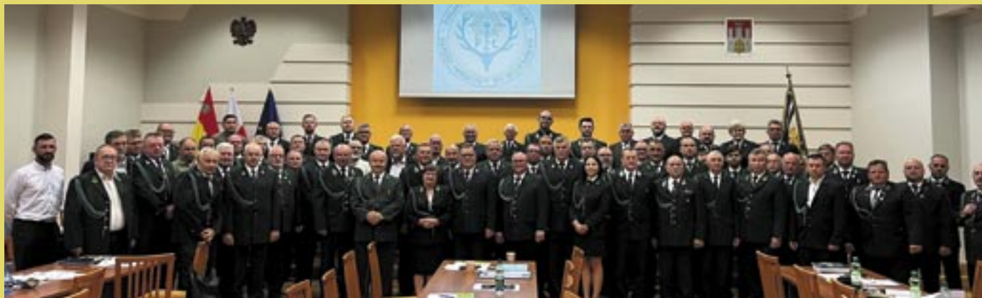
Uczestnicy w okręgowym zjeździe delegatów we Włocławku.