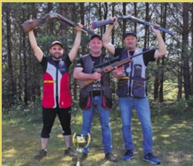
Reprezentacja Koła Łowieckiego Nr 106 „Brać Strzelecka”.